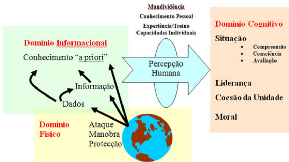
Figura 2 – Os Domínios da GCR

Existe uma relação entre cada um dos termos da linguagem utilizada e o domínio onde esse termo deve ser entendido. No domínio físico existe a situação que a força militar quer influenciar. É o domínio da realidade. Aí ocorre o ataque, a protecção e a manobra, no ambiente aeroespacial, naval e terrestre. É o domínio onde residem as plataformas físicas e as redes de comunicações que as interligam. Em termos comparativos, os elementos deste domínio são os mais fáceis de medir. Como consequência, o potencial de combate tem sido medido, ao longo do tempo, em termos de letalidade e sobrevivência, principalmente neste domínio.