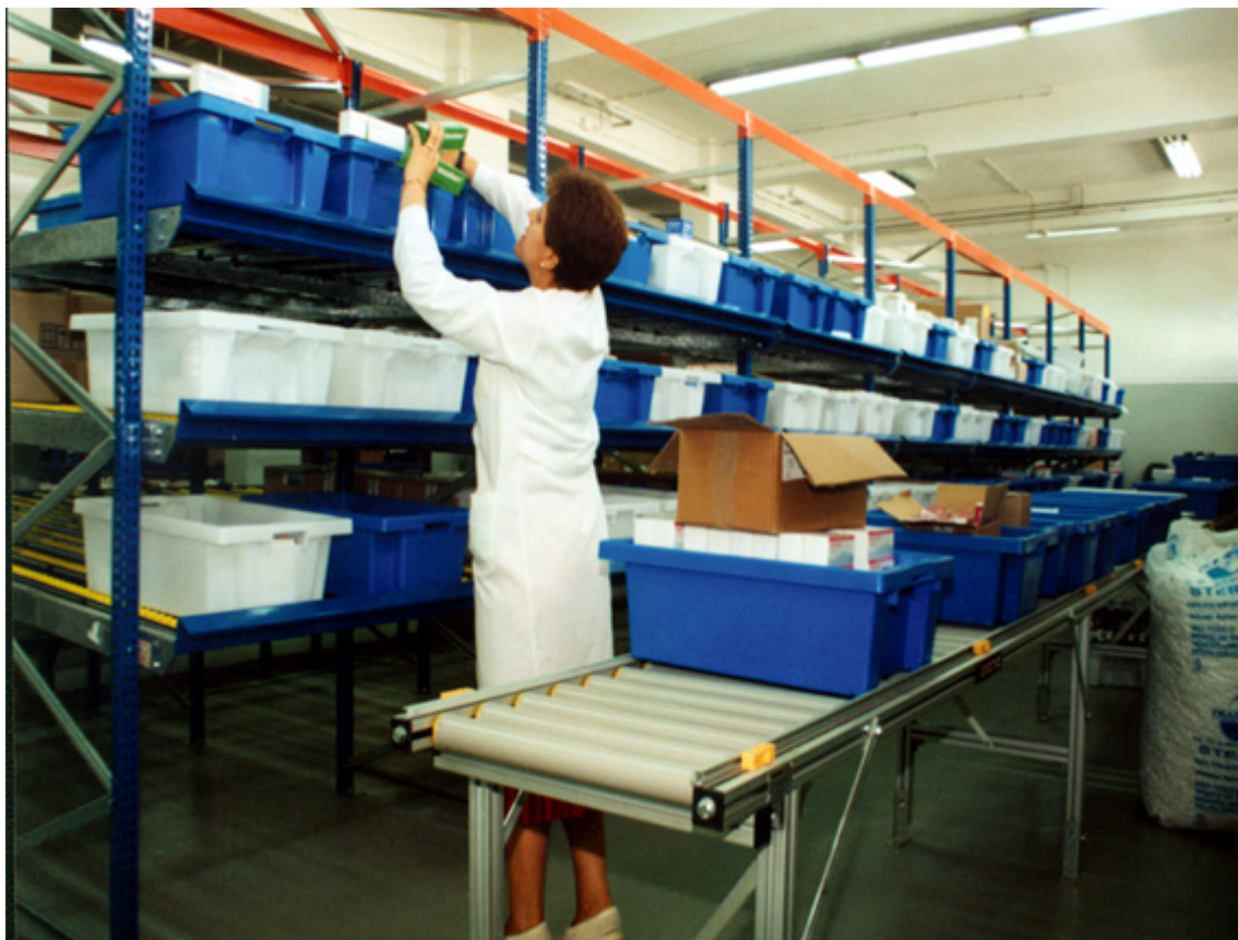
Fig 5 - Reserva sanitária de medicamentos.