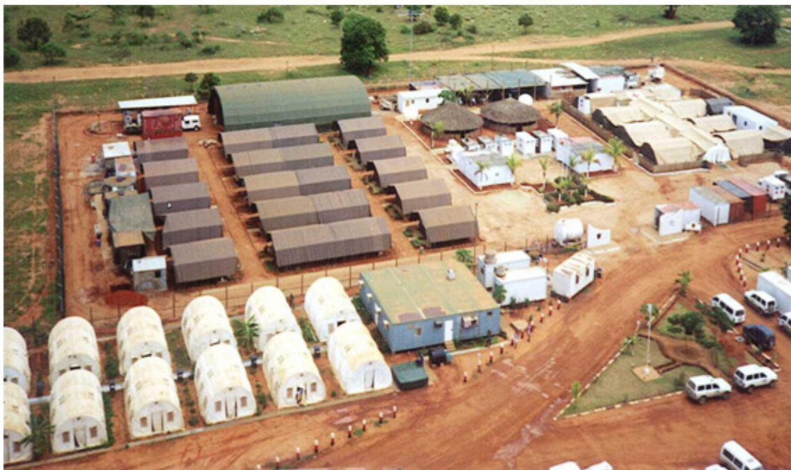
Fig 3 - Destacamento Sanitário 7 MONUA, 1997.