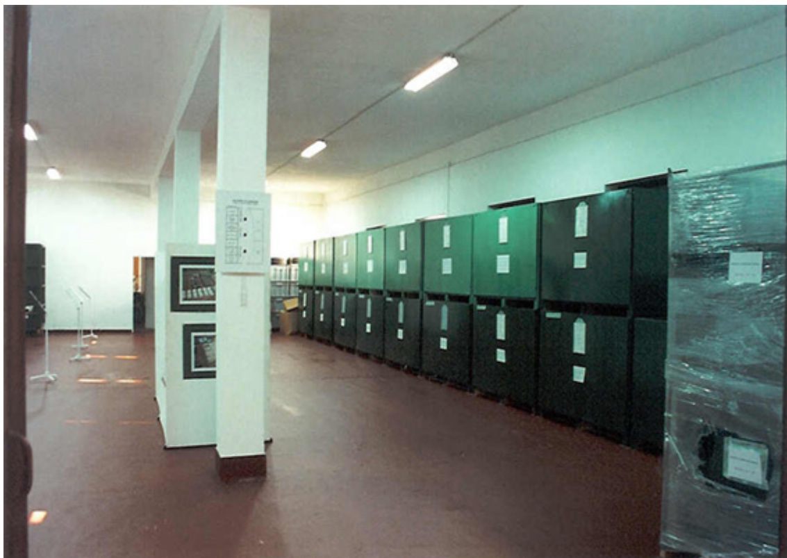
Fig 6 - Reserva sanitária de equipamentos para o Hospital de Campanha.